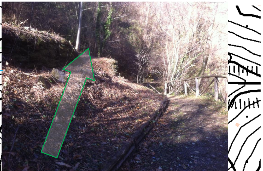
4: innesto della pista di nuova realizzazione sulla pista esistente