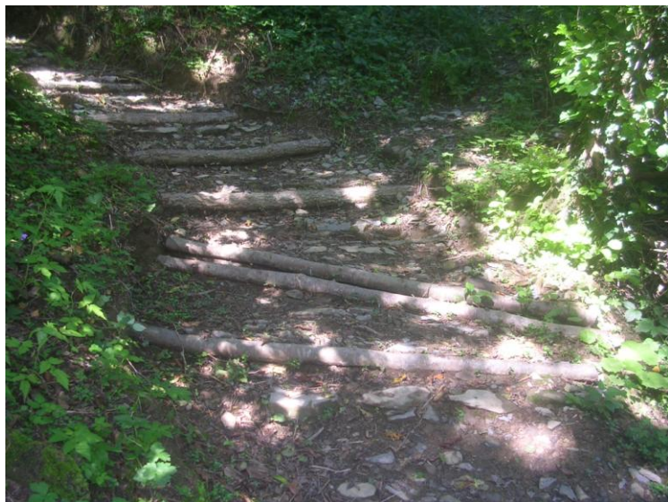
Scalini in legname e sciacqui

Ripristino di attraversamenti o guadi mediante demolizione in roccia e realizzazione di muretti in pietrame di raccordo in corrispondenza dei guadi.