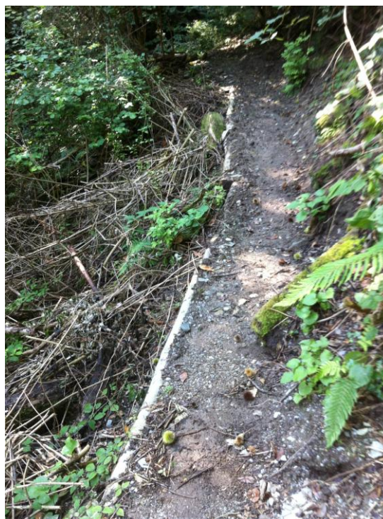
palo di bordo a rinforzo ciglio di valle