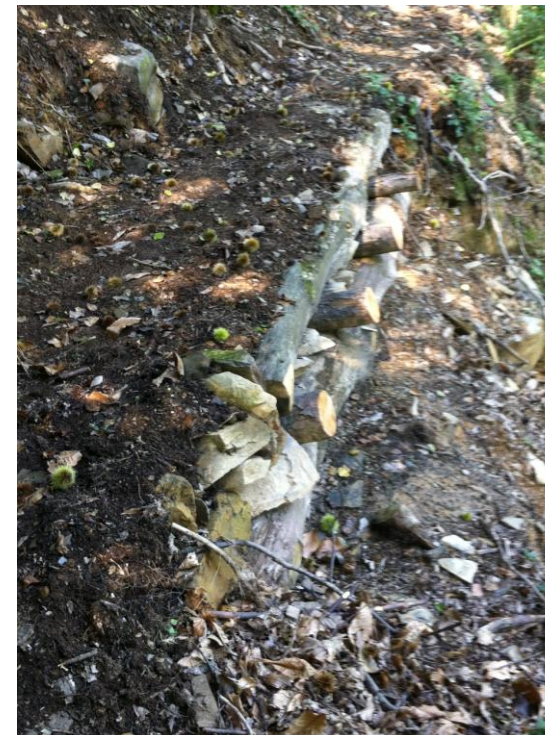
riempimento con legname e pietrame